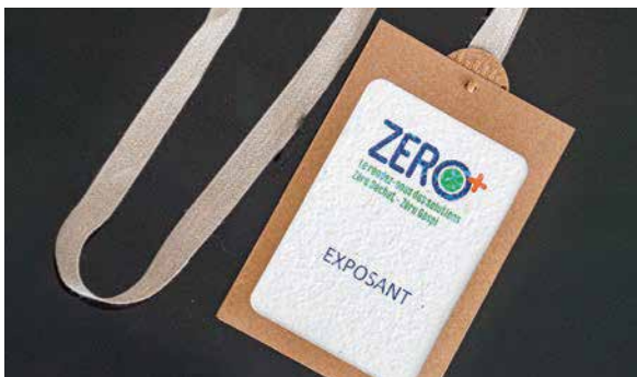
Atbre à bulles

Lors de la visite du pape à Marseille, les terrasses des brasseries du Vieux-Port ainsi que les chemins de randonnée étaient jalonnés de marcheurs abrités sous des chapeaux distribués la veille au Stade Vélodrome. Ces objets ont rencontré un grand succès lors de l'évènement, ont été utilisés tout le week-end et sont désormais des articles de collection de cet instant mémorable.