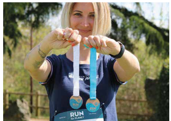
Run for Planet by Ethics Event

La démarche de sensibilisation a été très appréciée et sera renouvelée lors des prochaines éditions.